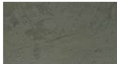
4228 Verde Montanha