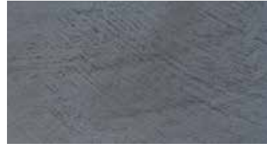
4216 Cinza Fragata